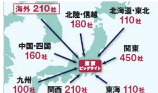
日本中・世界中から、1530社* が出展します (*予定)