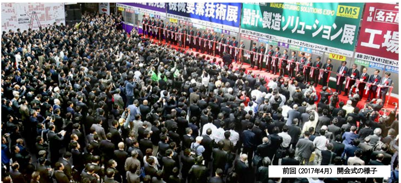
前回(2017年4月)開会式の様子

取材の申込みはこちら >>> http://www.dms-nagoya.jp/shuzai/