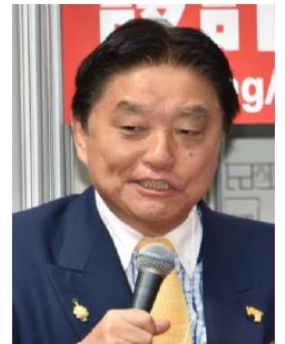
河村たかし 名古屋市長

下の写真は、まさに参列者をご紹介しているときの写真です。約2,000名の観客が詰めかけ、入口から人が溢れるほど、会場は熱気に包まれました。今年は大手製造業のVIP 42名を参列者に迎え、さらに盛大に開催。昨年同様、開会を待ち望む人で溢れかえる事が予想されます。この熱気は、この会場にいる人しか分かりません。本展のオープニングを盛り上げるため、ぜひご参加ください。(※テープカッター一覧は次ページを参照ください。)