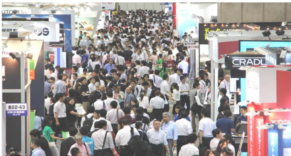
ビッグサイトの東ホール全館と西ホールを使用して開催