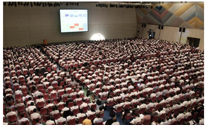
多数の受講者が参加したセミナー会場